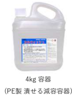
4kg 容器 (PE製 潰せる減容容器)