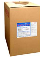
18kg 容器 (内袋：PE製 潰せる減容容器)